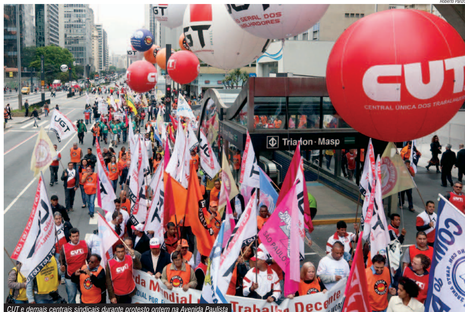
CUT e demais centrais sindicais durante protesto na Avenida Paulista

Trabalho decente é aquele adequadamente remunerado,