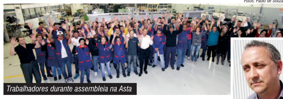
Trabalhadores durante assembleia na Asta

A primeira parcela será quitada este mês e a segunda em abril de